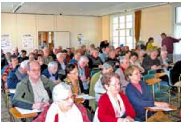
Assemblée générale, Pays de la Loire.

Bon, finalement, j'ai trouvé un épisode (tragi-comique, mais pas si nul !).