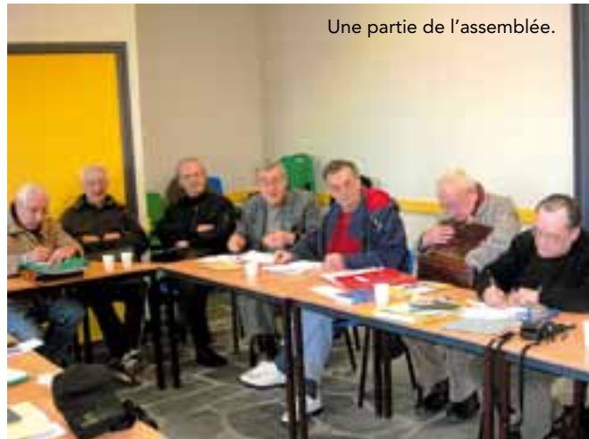
Une partie de l'assemblée.